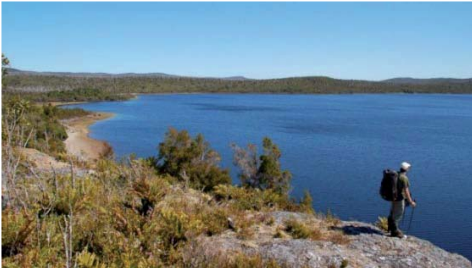
Organización Tantauco Exploration Race 2012

A partir de hoy y hasta el sábado 7 de abril, se está desarrollando la Tantauco Exploration Race 2012 , prueba que se realizará los días 4, 5 y 6 de abril, en el Parque Tantauco, en la isla grande de Chiloé.