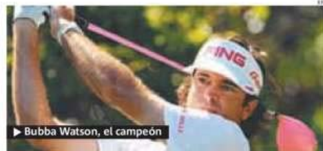
► Bubba Watson, el campeón