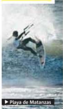
► Playa de Matanzas